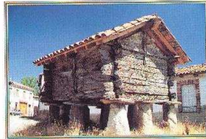
Vista de la Plaza con el Negrellón.

Su ritual es San Pelayo y celebra sus fiestas patronales el 26 de Junio.