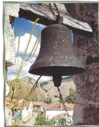
ABRADOS DE BONAR

(ATRATUM o terreno opacado o oscuro). Se menciona en el año 1008 como EDRADOS. Antiguamente estaba integrado en el concejo de La Vega de Boñar y Abadía de Valdediós. Distra 4,2 km. de Boñar, en zona montañosa, existiendo en su término la Cueva del Figar y con escalacitas y stalagmitas muy interesantes. Es también abundante en fosiles cambrios. En su territorio se conserva una mina de hierro explotada por los romanos en la que aparecieron instrumentos de trabajo de la época. También es famoso su pinar. Su iglesia parroquial es del siglo XVII y tiene como titular a la Asunción de la Virgen. Celebra fiestas patronales el día 14 de septiembre.