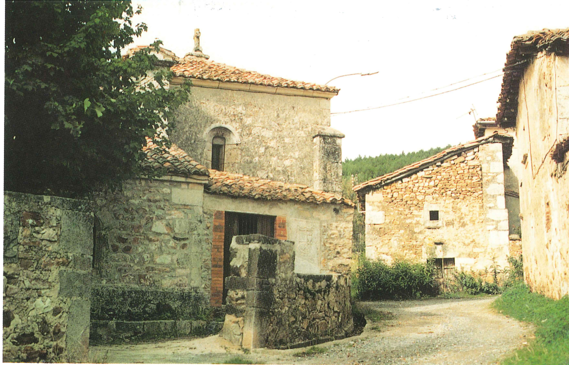
Plaza de la Iglesia en Voznuevo