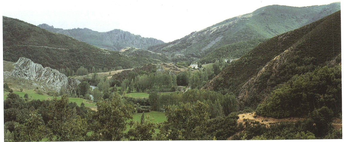
Vista del valle de Valdecastillo

Es famosa su Venta de Remellán y minas de sílice, celebrando las fiestas patronales el día 4 de Septiembre.