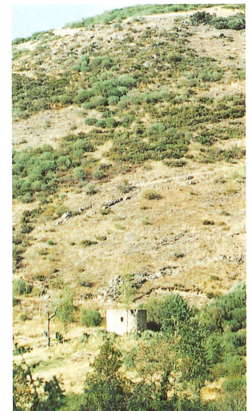
Torreón de Remellán