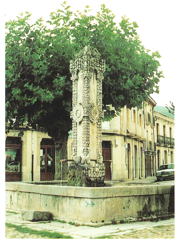
Fuente plaza del Negrillón

Boñar pertenece al partido judicial de León y dista de la capital leonesa 47 Km.